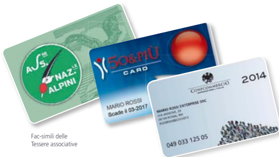
Fac-simili delle Tessere associative

L'iniziativa è valida dal 01/01/2014 fino al 31/12/2014